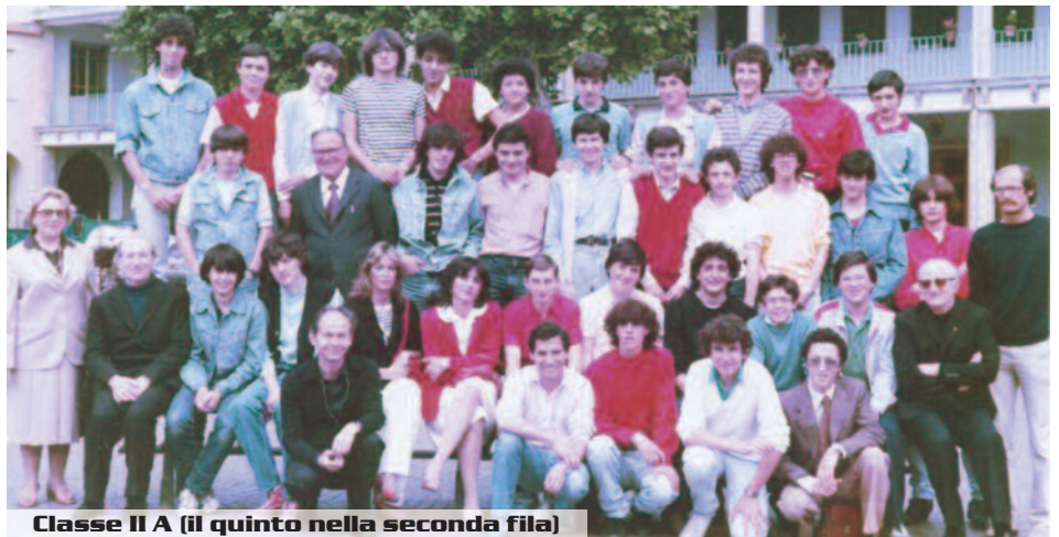
Classe II A (il quinto nella seconda fila)