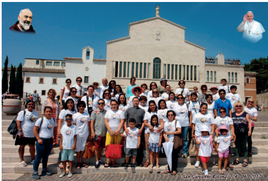
San Giovanni Rotondo 24 - 06 - 2017