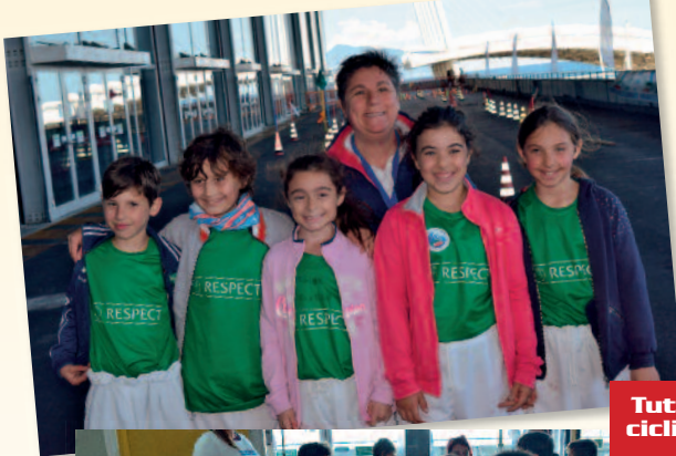
Tutti i ciclisti