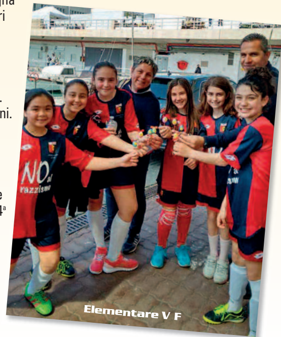
Elementare V F