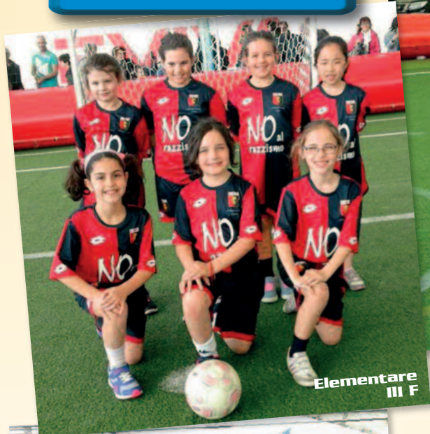
Elementare III F