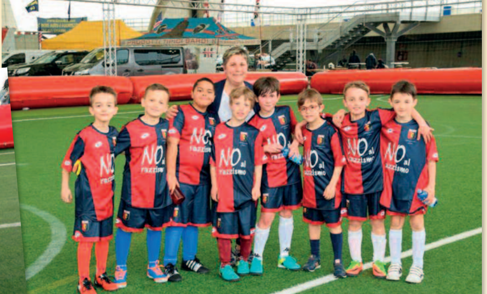
Elementare III M