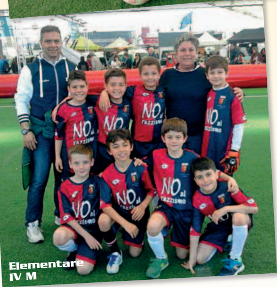
Elementare IV M