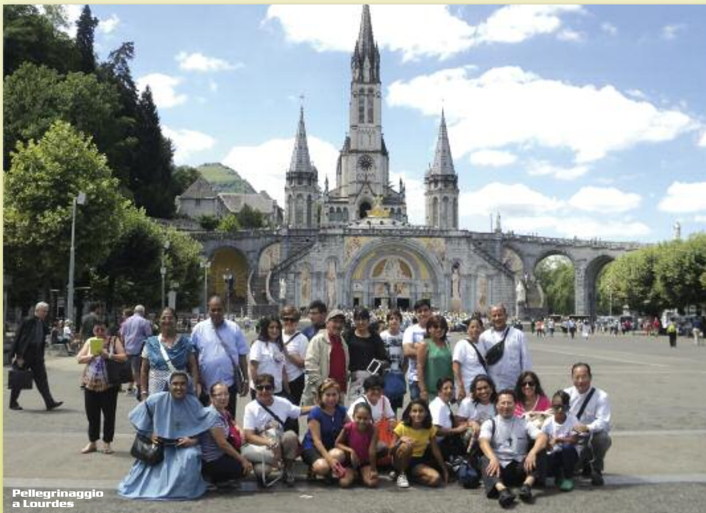
Pellegrinaggio a Lourdes